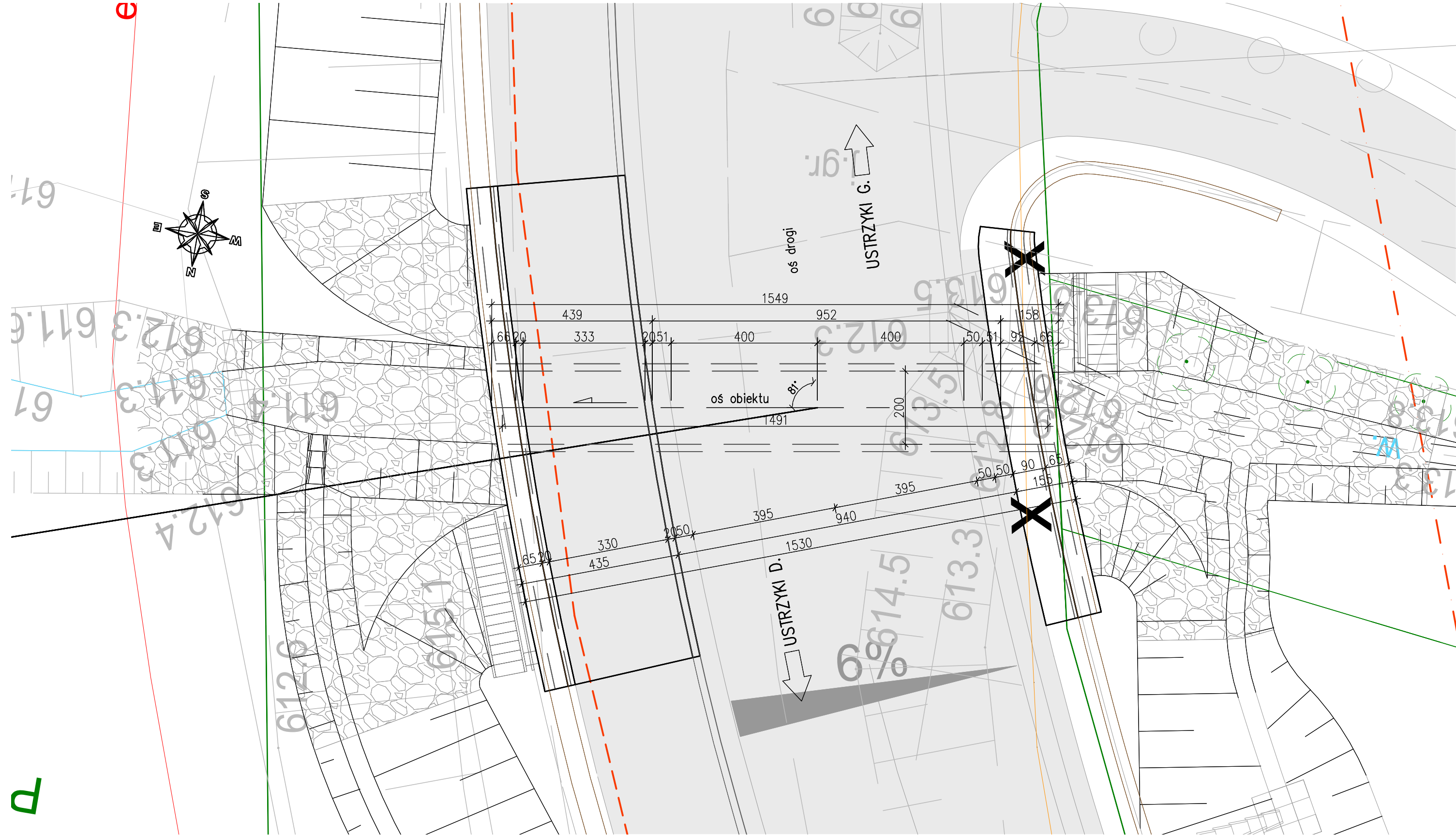
Widok z góry SKALA 1:100